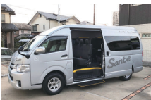
ステップが自動で出て乗り降り楽々