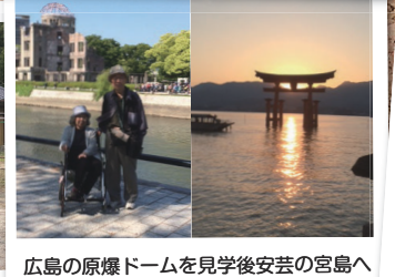
広島原爆ドームを見学後安芸の宮島へ夕日が沈む絶好の瞬間に遭遇！