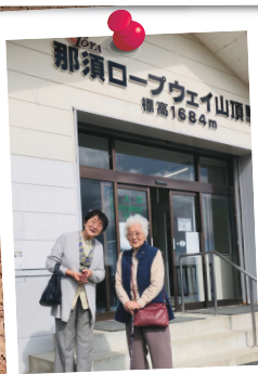
那須ロープウェイにて360度の紅葉パノラマを楽しみました。