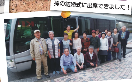
バスでの移動は楽々！太極拳「健美会」のみなさま