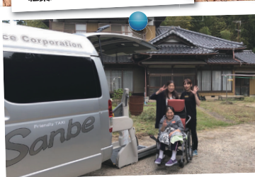
病院からの一時帰宅。娘と笑顔で記念撮影！