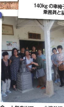
今、人気のツアー。小湊鉄道、里見駅。話題のトロッコ電車を楽しみました。10名様参加、59,800円(税別) 高速代別途。