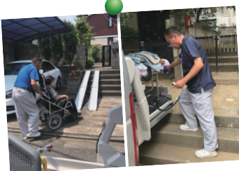
退院、退院時どんな難所でもお部屋にお連れ致します