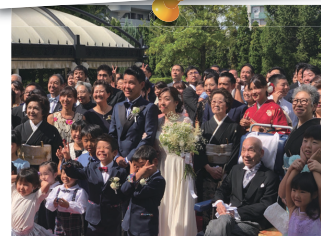
娘と一緒にバージンロードを歩きました