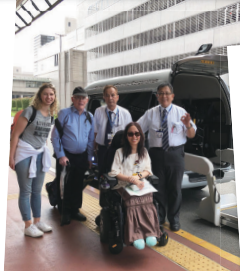
140kgの車椅子も楽々移送 乗務員と記念撮影