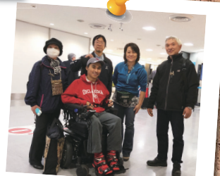
アメリカから来日のお客様をお迎えに！

弊社では1名様から26名様までニーズにあった車両をご用意できます。弊社は法令遵守でのサービスを提供いたします。