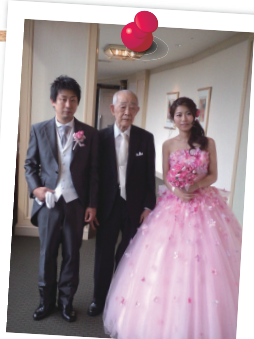
孫の結婚式に出席できました！