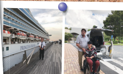
豪華客船クルーズに参加。横浜港~成田空港送迎